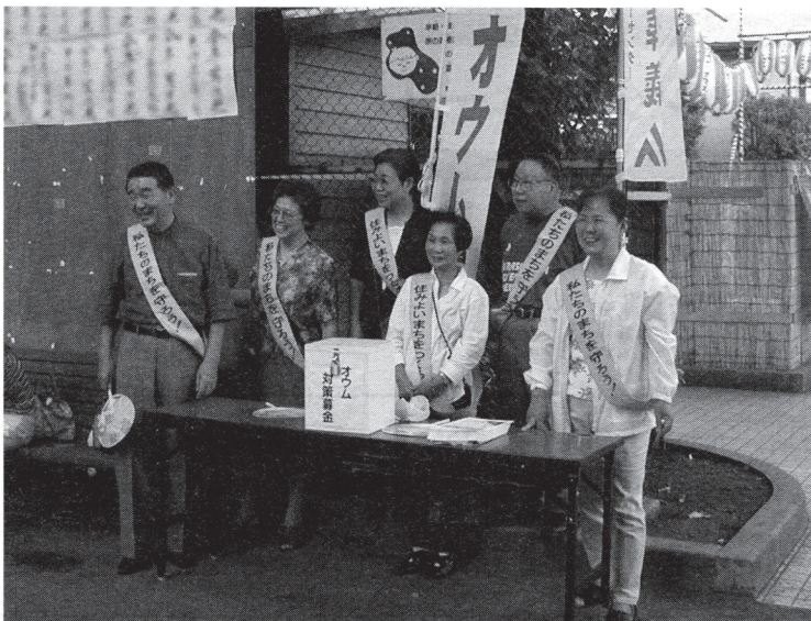
リンレイ公園で募金活動をする実行委員

私たちオウム対策住民協議会の活動は、お寄せいただいた皆様の募金によって運営されています。