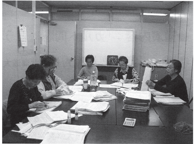
署名の集計をする署名募金部会

4月8日現在 署名 43,100名 2月1日～3月28日迄 募金131,288円